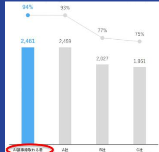
約2,500字を各サービスで文字起こしした認識数と認識率データ